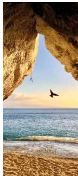
DAL CIELO E DAL MARE