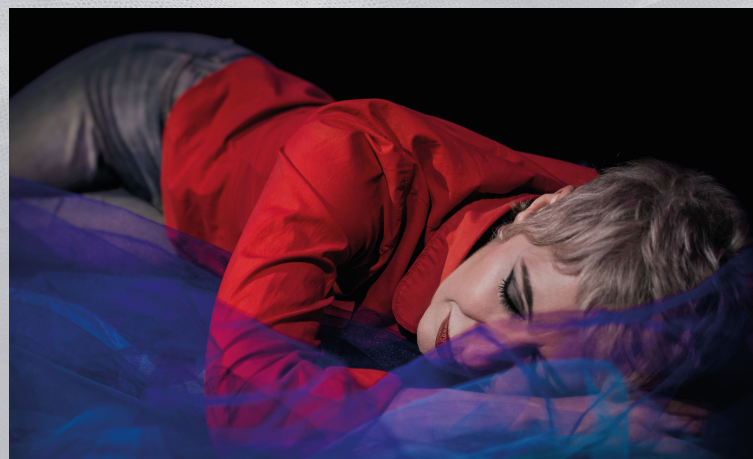
Foto di scena dallo spettacolo "MAMMA A CARICO - Mia figlia ha novant'anni"