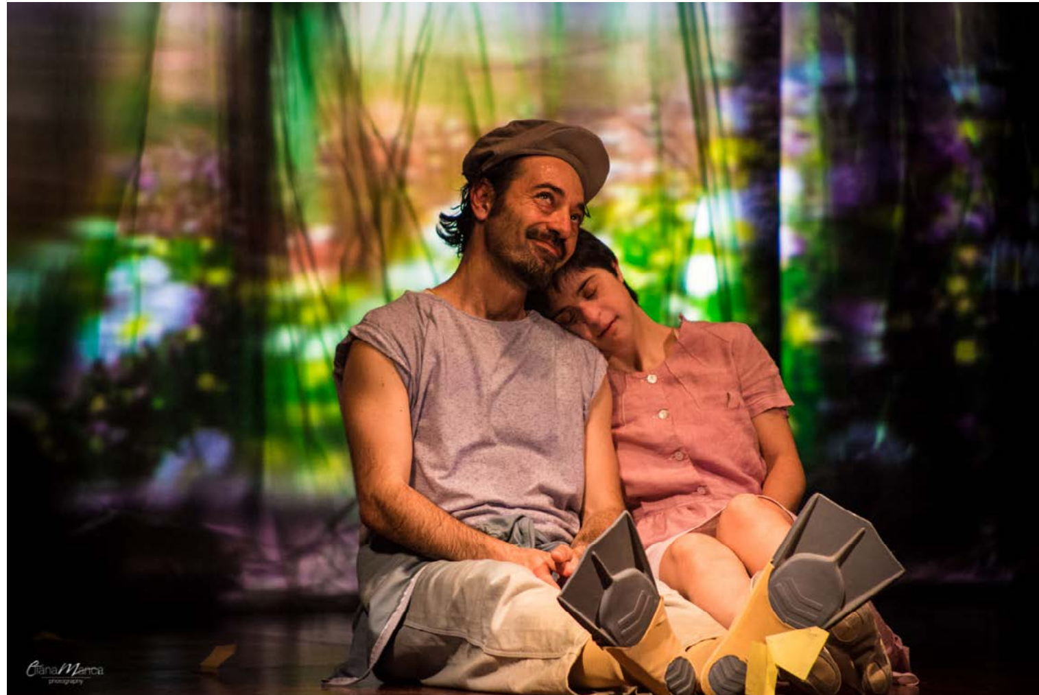
E che avere un amico speciale ci fa stare bene