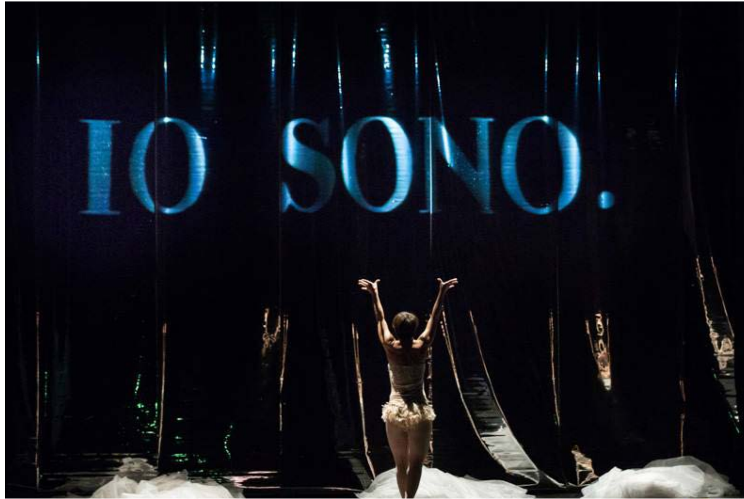
L'anatroccolo si specchia e scopre di essere un cigno