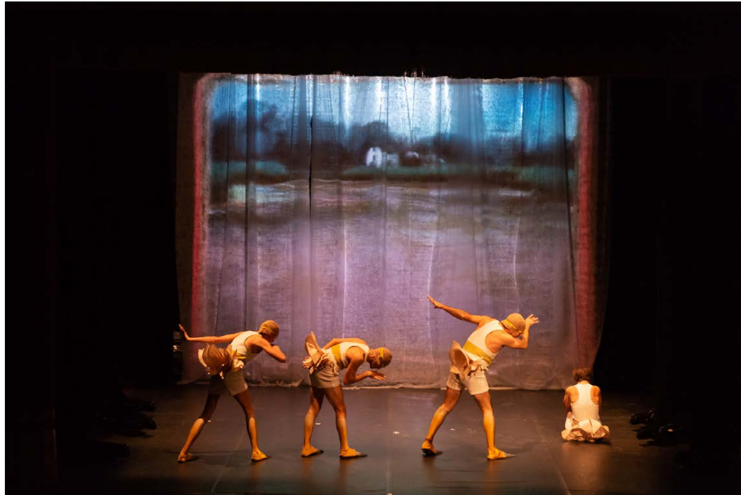
Le prime tre uova si aprono e danno vita a 3 simpatici anatroccoli