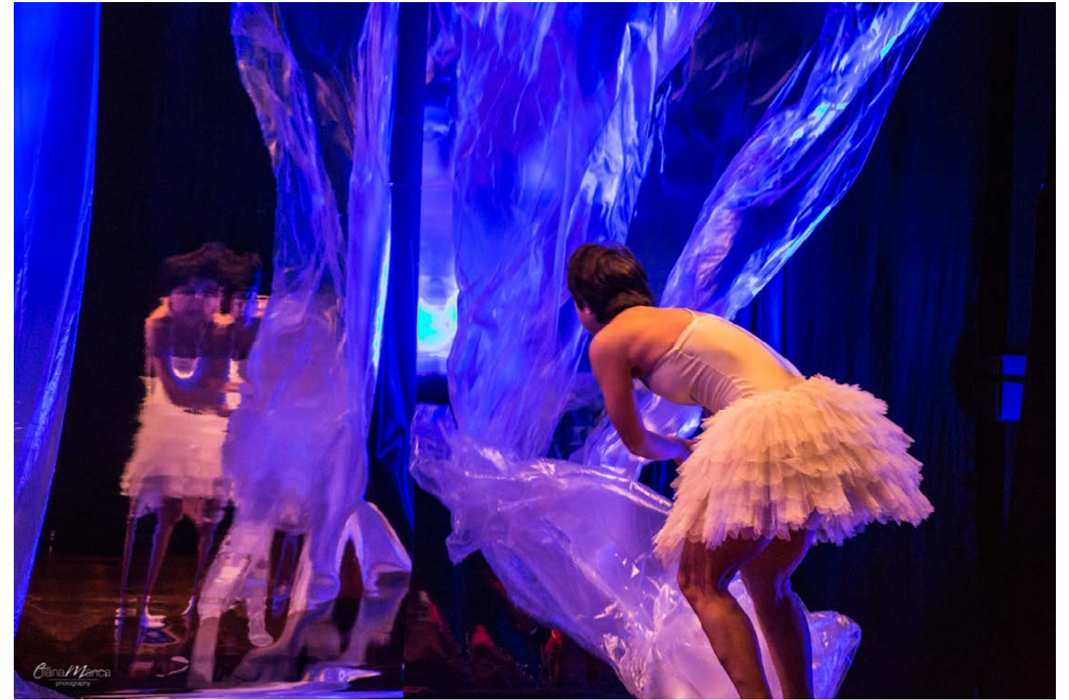
Si avvicina alle pagine del diario e le strappa via facendole cadere a terra