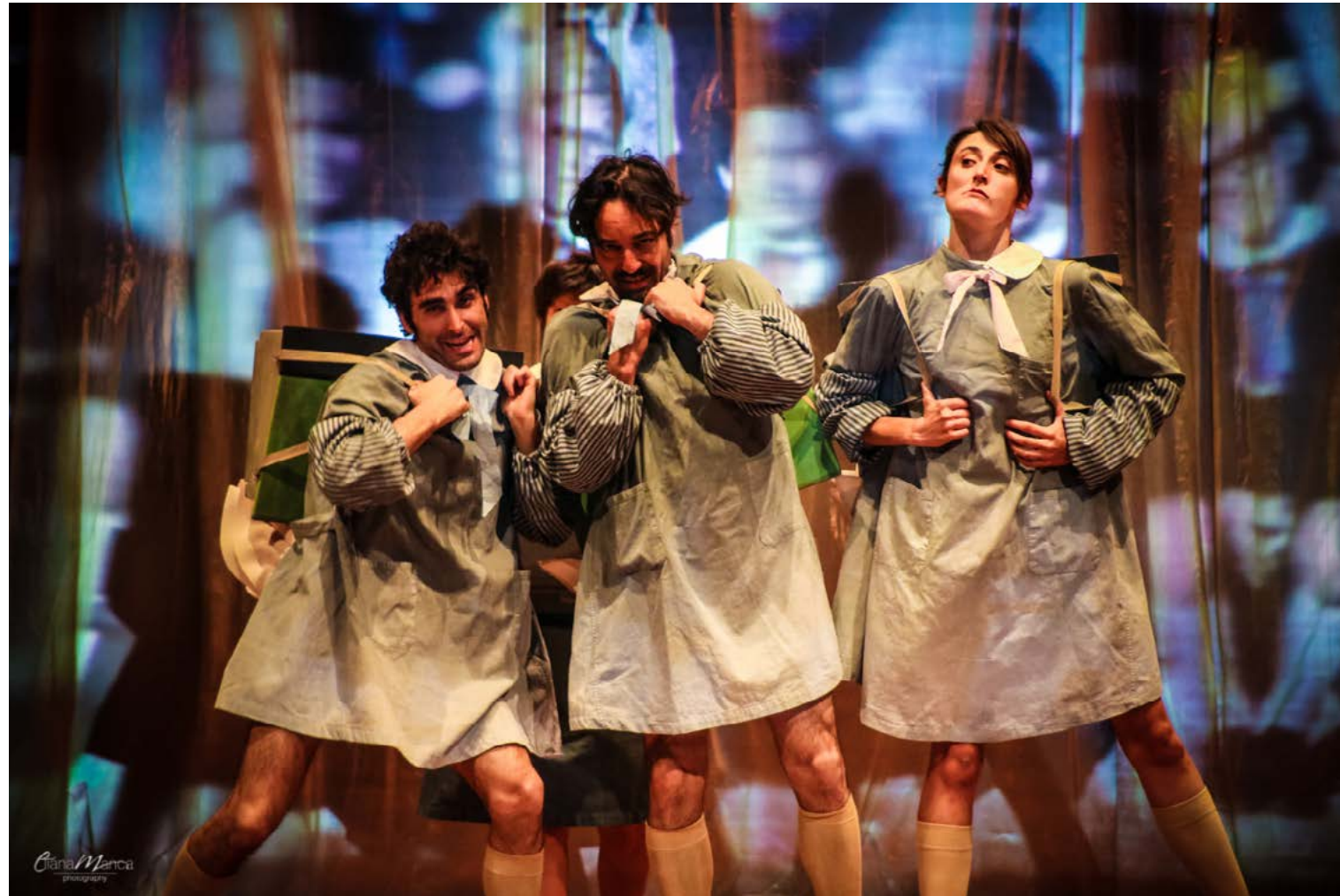
Sin dall'inizio fanno dei dispetti al nostro anatroccolo