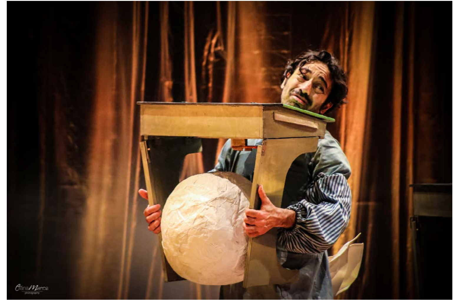
E alle volte le palline di carta lanciate possono essere davvero pesanti.