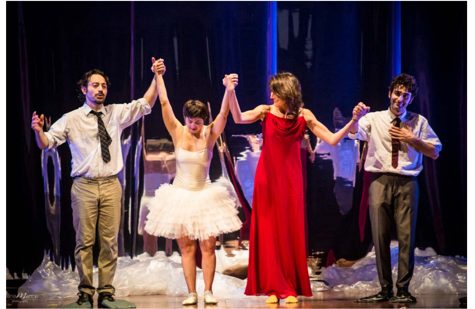
Gli applausi finali.