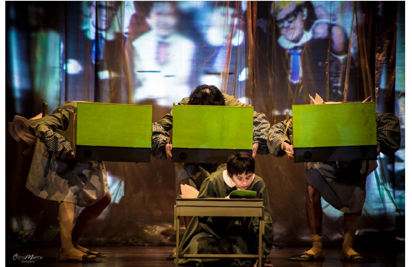
Si nascondono per lasciarlo solo e per giocare solo tra loro