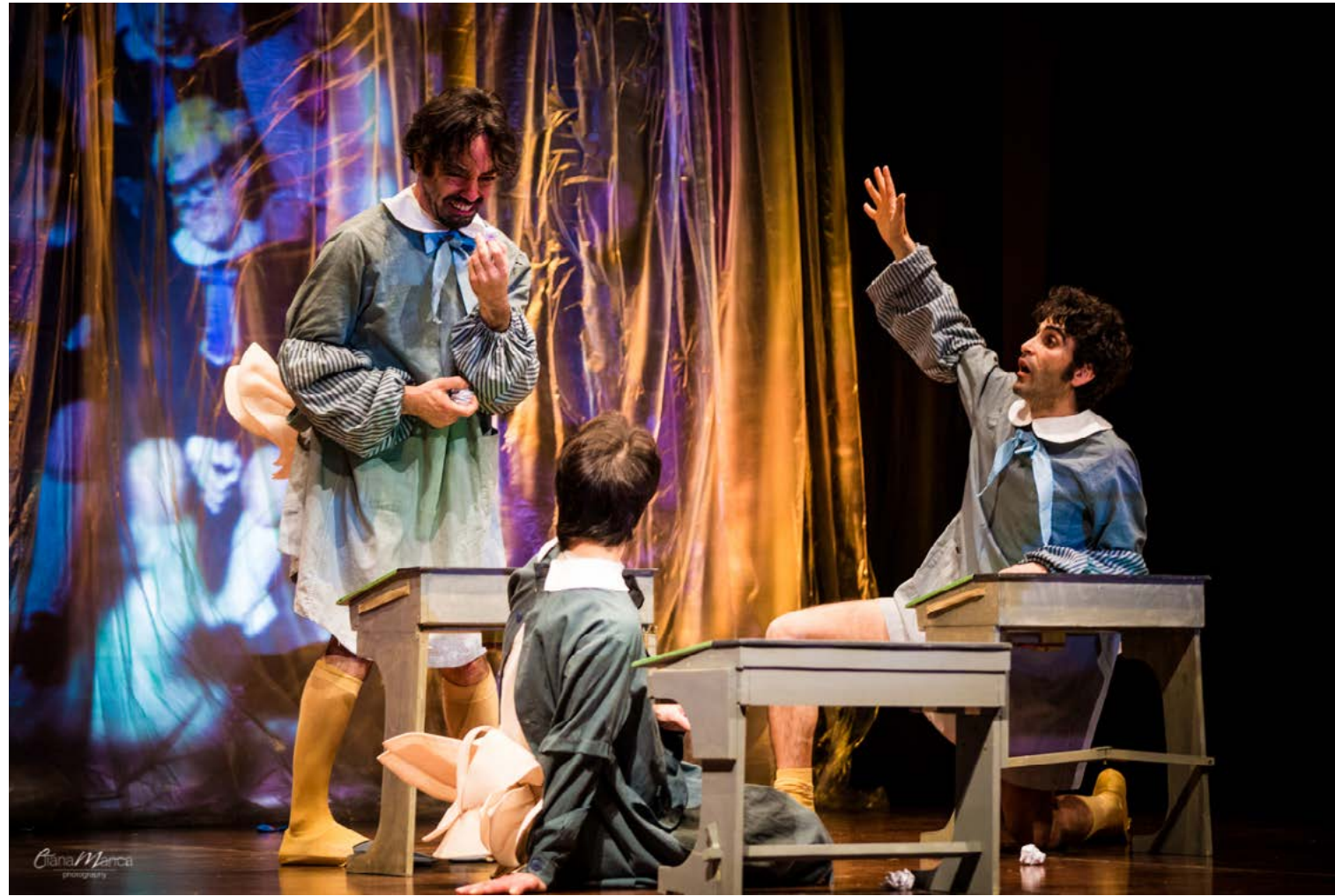
Gli lanciano palline di carta tutto il tempo da dietro