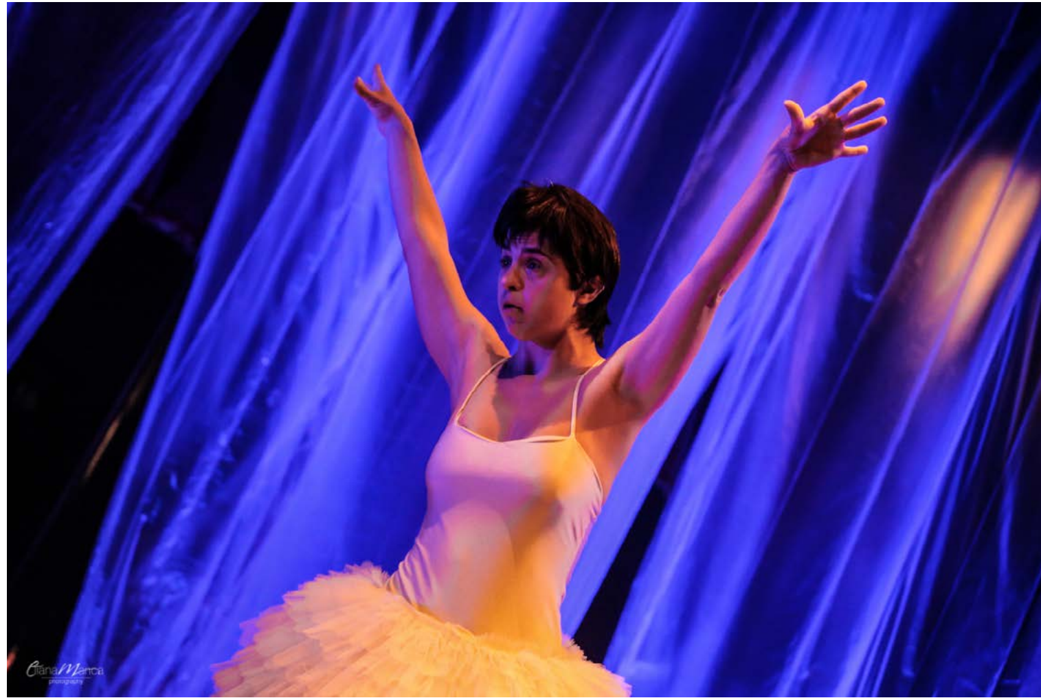
Si rialza e inizia a ballare leggero