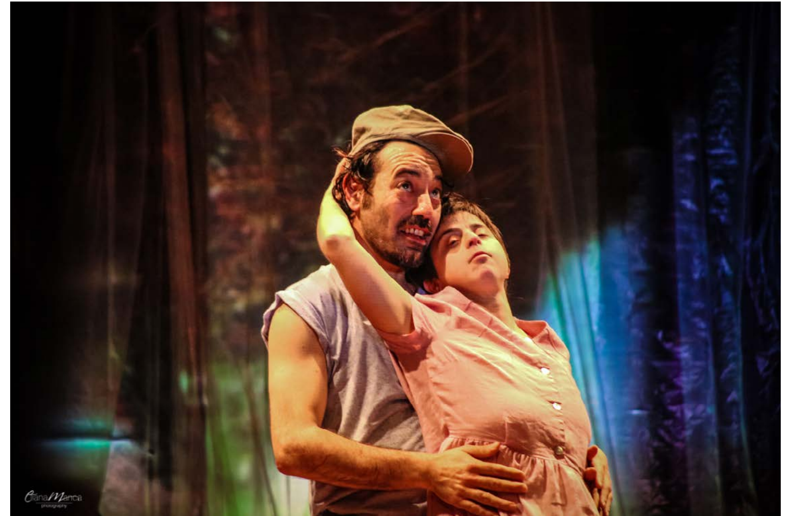
I due ballano e si divertono insieme con tenerezza