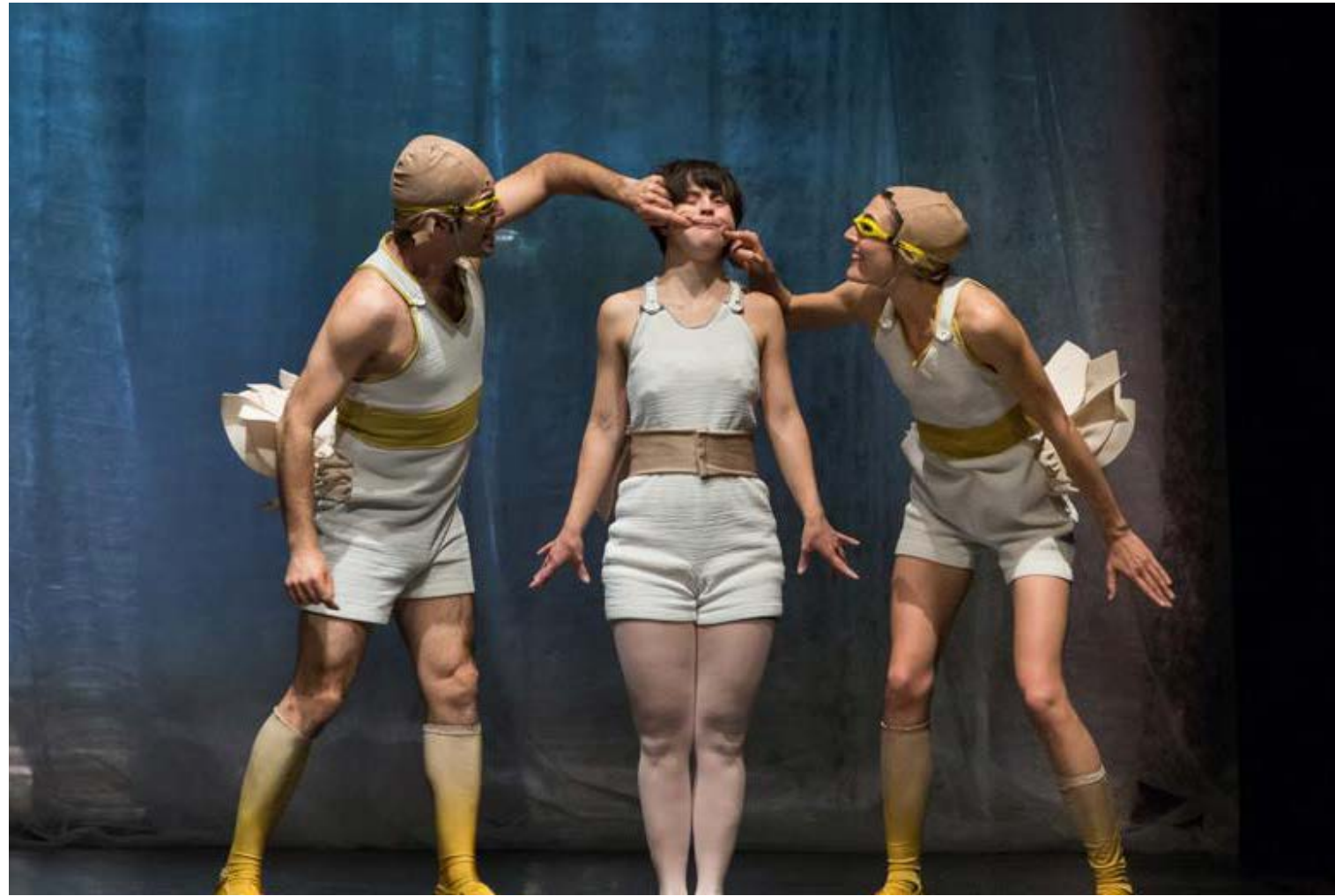
Lo guardano con attenzione