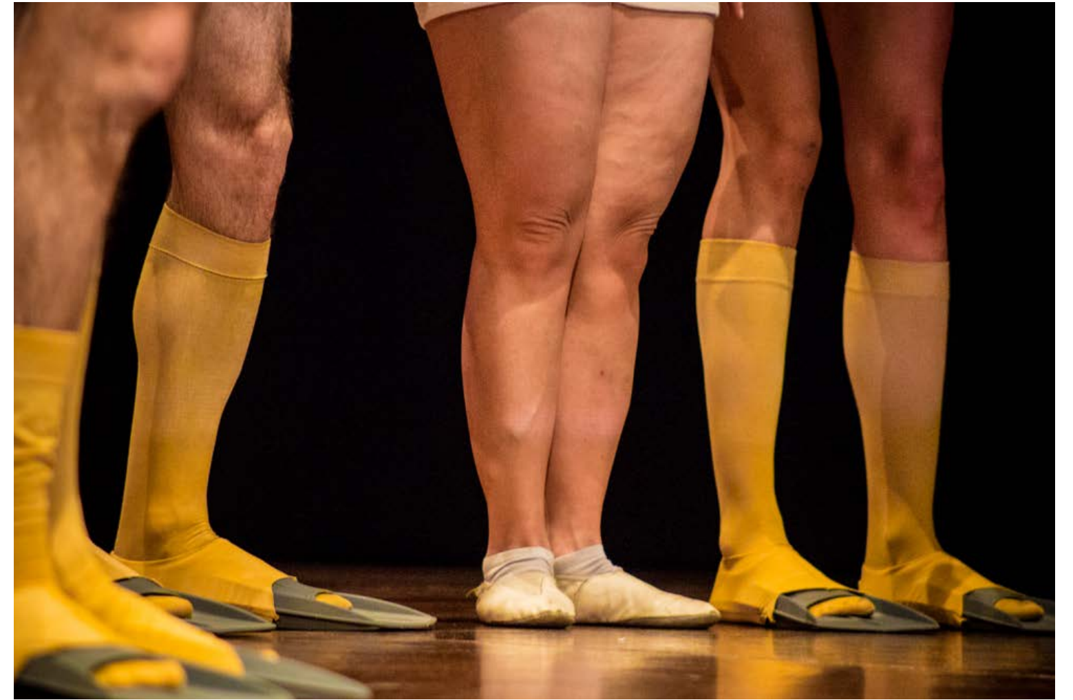
e si accorgono che ha qualcosa di diverso da loro